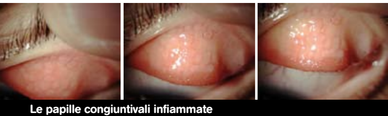
Le papille congiuntivali infiammate

Per le donne la causa molto spesso è da ricercarsi in un'intolleranza a trucco e cosmetici in generale, compresi quelli definiti ipoallergenici che non sono mai privi totalmente di allergeni. La semplice sospensione dell'applicazione del cosmetico irritante consente di ottenere il miglioramento dei sintomi.