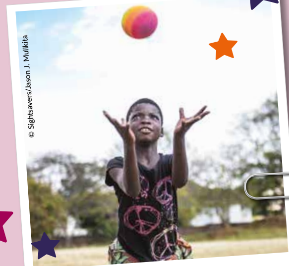
Ora grazie a voi sorride felice!